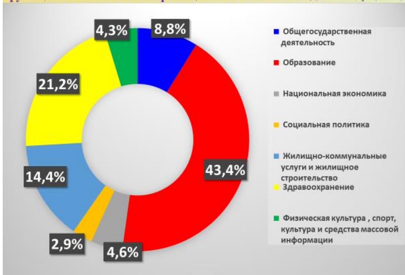
Структура расходов консолидированного бюджета по функциональной классификации на 01.07.2024 года (процентов)

На финансирование жилищно-коммунального хозяйства направлено 4 884,8 тыс. рублей в пределах уточненных планов отчетного периода. В том числе субсидии на возмещение части расходов от оказания населению жилищно-коммунальных услуг профинансированы в размере 3 922,2 тыс. рублей, на текущий ремонт жилфонда направлено 56,8 тыс. рублей, на